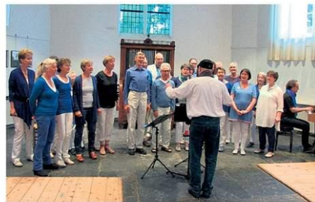
sWing in het Witte Kerkje in Heiloo dat ook prominent op de hoofdfoto staat.